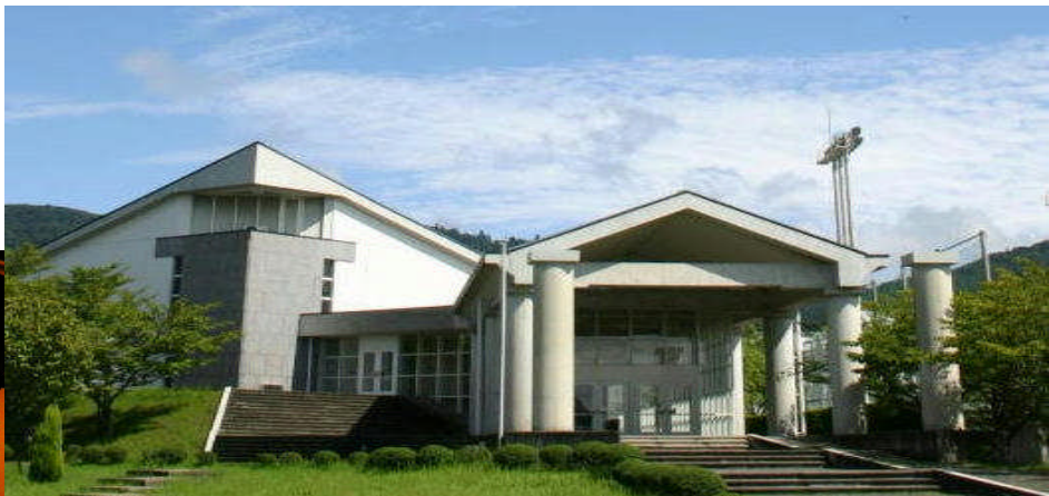
奈良教育大学講堂 (パルテノン)

寝屋川市中学生サミット ネットいじめ撲滅劇 「夕日の見える教室で(オリジナル劇)」上演